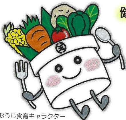
はちおうじ食育キャラクター はっちくん

健康づくりや食育に関する楽しい体験がいっぱい!! 家族・友達と一緒に遊びにきてね!