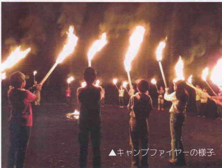
▲キャンプファイヤーの様子

大自然の中で過ごす二泊三日。 たくさんの友達と たくさんの思い出を 作りにいこうよ!