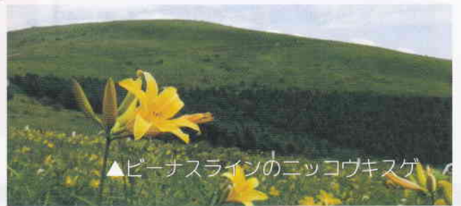
▲ビーナスラインのニッコウキスゲ

大自然の中で過ごす二泊三日。 たくさんの友達と たくさんの思い出を 作りにいこうよ!