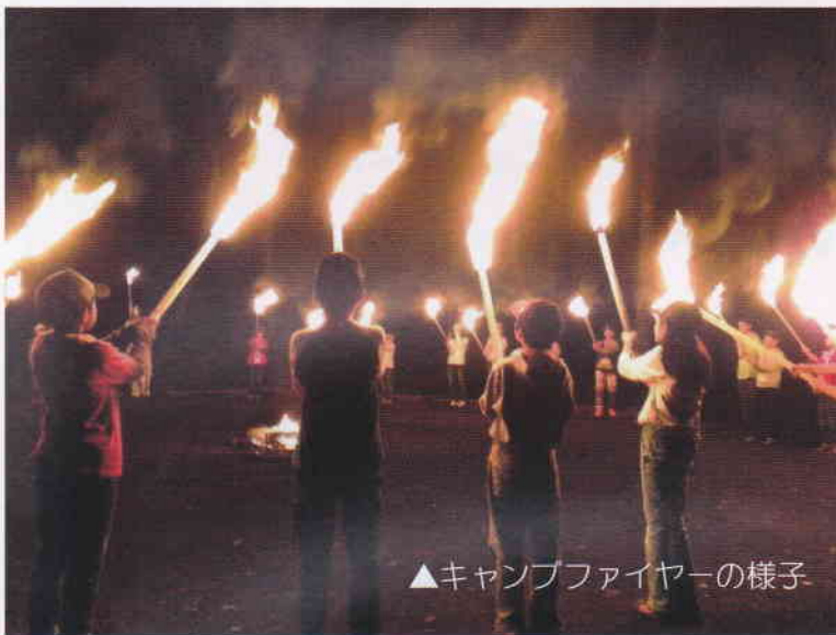
▲キャンプファイヤーの様子

大自然の中で過ごす二泊三日。 たくさんの友達と たくさんの思い出を 作りにいこうよ!