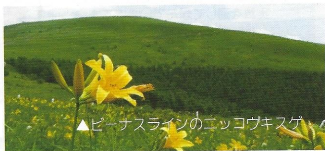
▲ビーナスラインのニコウキスゲ

大自然の中で過ごす二泊三日。 たくさんの友達と たくさんの思い出を 作りにいこうよ!