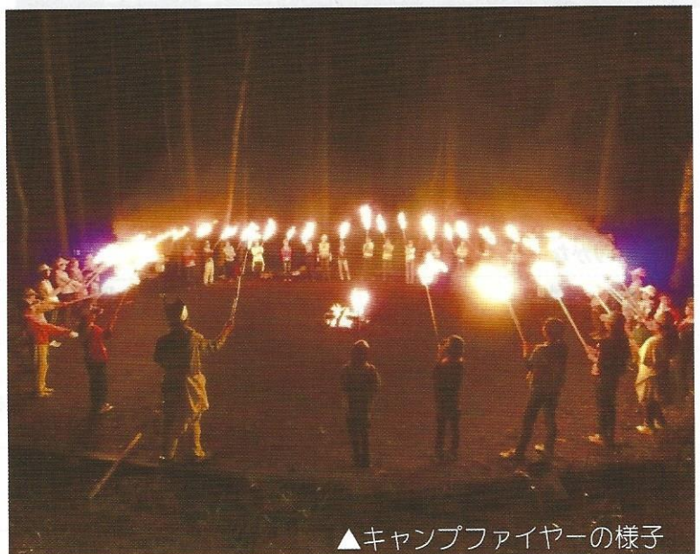
▲キャンプファイヤーの様子