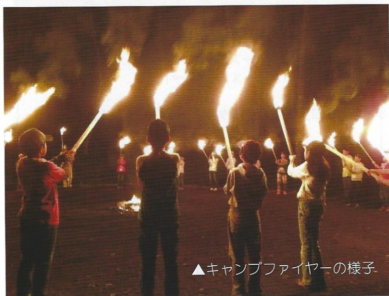
▲キャンプファイヤーの様子

大自然の中で過ごす二泊三日。 たくさんの友達と たくさんの思い出を 作りにいこうよ!