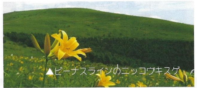
▲ピーナスラインのニッコウキスゲ

大自然の中で過ごす二泊三日。 たくさんの友達と たくさんの思い出を 作りにいこうよ!