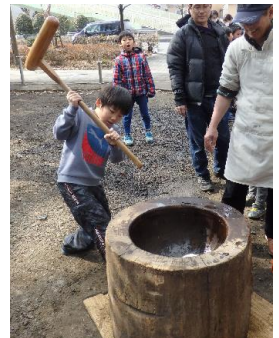
〈六年生を送るもちつき会〉

最後に、地子連の皆様のご尽力にあらためて心より厚く御礼申し上げますと共に、今後ともどうぞよろしくご指導賜りたくお願い申し上げます。本年度も本当にありがとうございました。