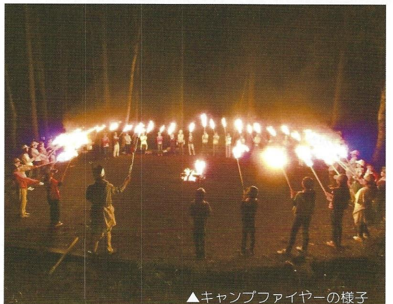
▲キャンプファイヤーの様子