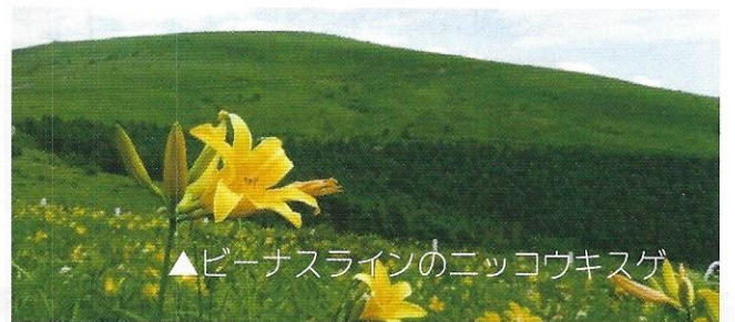
▲ピーナスラインのニコウキスゲ

大自然の中で過ごす二泊三日。 たくさんの友達と たくさんの思い出を 作りにいこうよ!