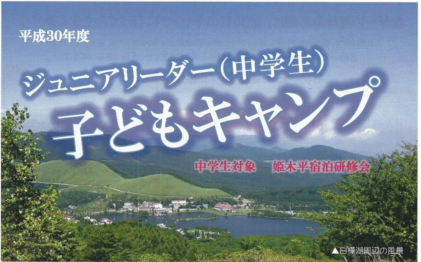
▲白樺湖周辺の風景