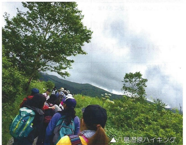
▲八島湿原ハイキング