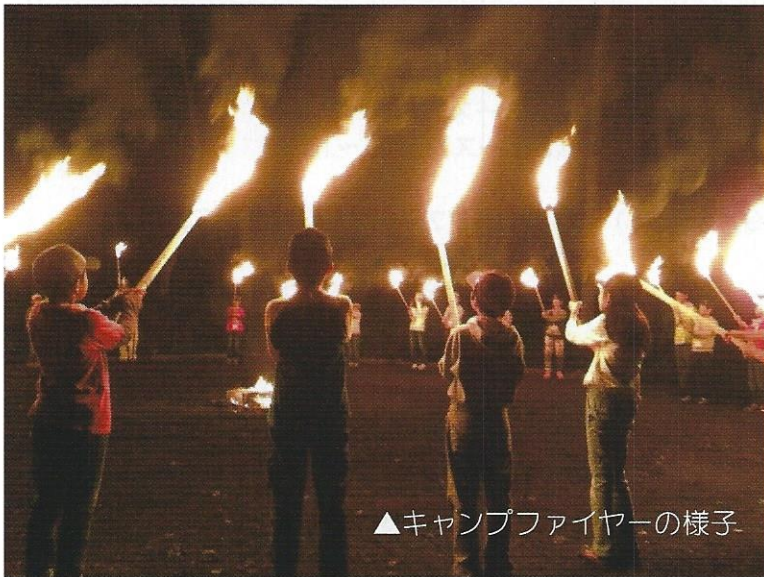
▲キャンプファイヤーの様子

大自然の中で過ごす二泊三日。 たくさんの友達と たくさんの思い出を 作りにいこうよ!