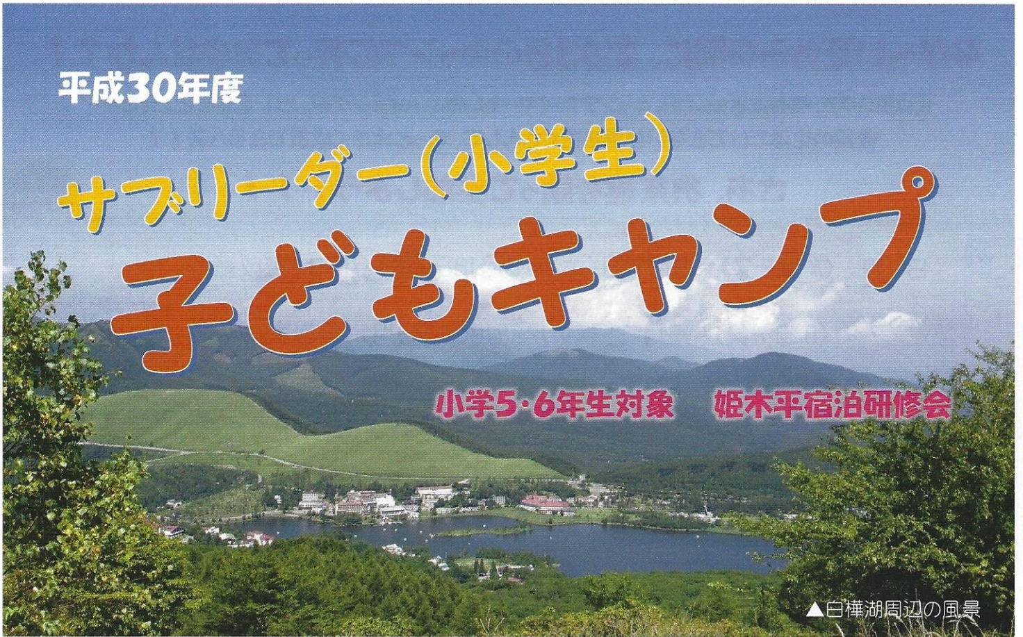
▲白樺湖周辺の風景