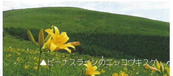
▲ビーナスラインのニッコウキスゲ

大自然の中で過ごす二泊三日。 たくさんの友達と たくさんの思い出を 作りにいこうよ!