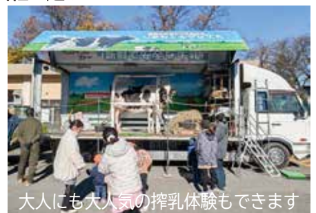
大人にも大人気の搾乳体験もできます