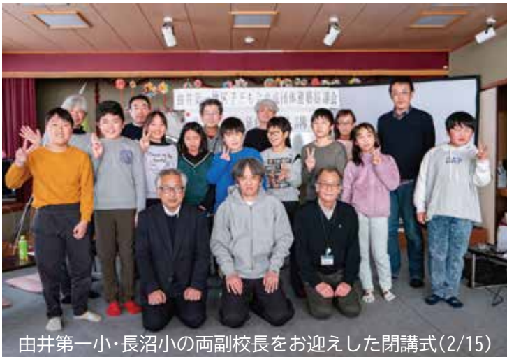
由井第一・長沼小の両副校長をお迎えした閉講式(2/15)

他人への干渉を良しとせず個人を尊重する世の中においては、子ども達の可能性を引き出す為にも、成功体験の積み上げによる自己肯定感の育成が必要です。地域の異年齢の交友も広がるサブリーダー研修会へのご参加を役員一同お待ちしております。