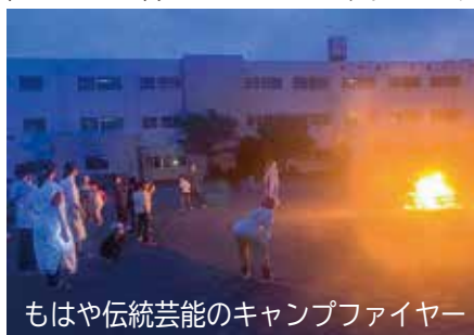
もはや伝統芸能のキャンプファイヤー