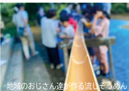
地域のおじさん達が作る流しそうめん

仲間達みんなで、みなさんのご参加を楽しみにお待ちしております。ぜひ、 気軽に遊びにいらしてください!!